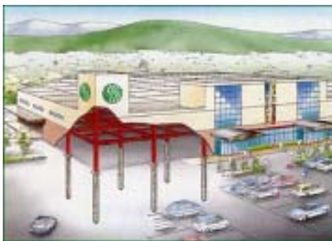
エコスフレームイメージ図

周辺・地球環境への配慮は当然の事。高い安全性・耐久性と低価格を誇る鉄骨建築です。