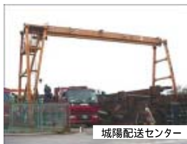
城陽配送センター